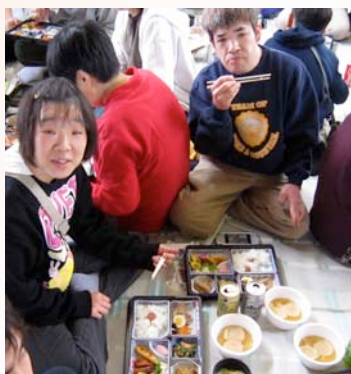
のんびり食事タイム