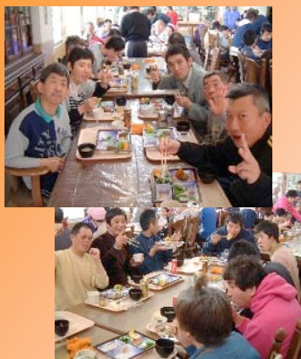
今年もがんばるぞー！

四月一日、毎年恒例の開園記念式を行いました。今年で、三和の里が開園して十八年目になりました。利用者の皆さんもまんべんなく歳をとっています。まだまだ元気です。記念撮影の後、お祝いのごちそうを食べ、今年一年の無事を祈りました。