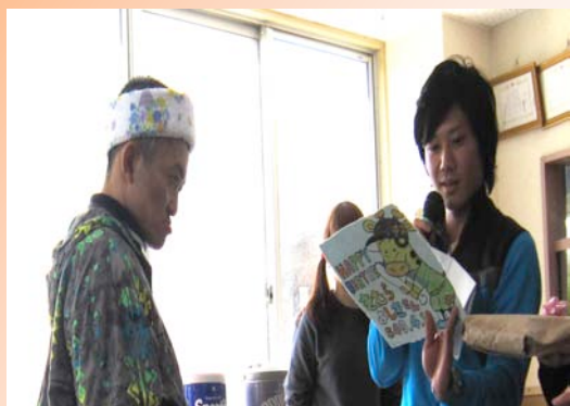
誕生会も行いました