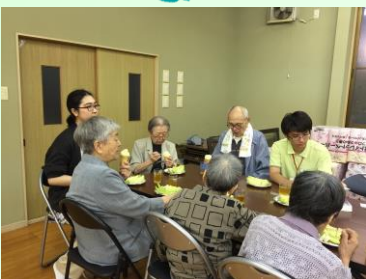
富士の高嶺に 降る雪も～

中佐渡夏祭り 八月十五日の夜に、中佐渡町会の夏祭りに参加してきました。 今年は、集会場の広いホールが会場となりました。 盆踊りやカラオケに参加し、地域の方々と交流できました。 カラオケでは、懐かしい「お座敷小唄」や「青い山脈」を歌いました。 参加賞やくじ引きなど、沢山の景品をいただきとても楽しく過ごしました。