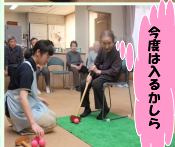
今度は入るかしら