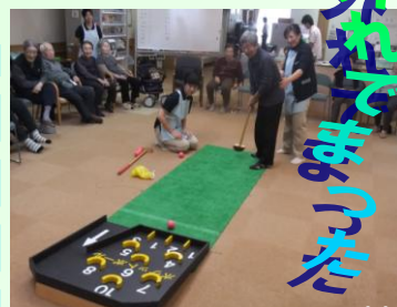
外れても構わない

デイサービスの一日は、午前の天然温泉での入浴と機能訓練、午後の利用者の皆様全員で行う集団体操と、利用者様個人個人、自らの意思で選んでいただくレクリエーションの時間と、大きく二つに分かれます。 レクリエーションは、三種類ほどが週がわりで、職員自らが利用者様の、身体的・精神的効果を願って一生懸命考え、ゲームをサポートしていきます。と堅苦しい話はここまでで、おのえの午後の時間は、笑い声と歓声で満開の楽しい時間です。いっぺん遊びに来てみねガア〜!